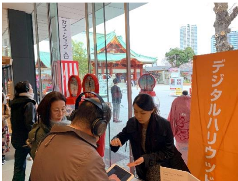
神田明神 東京都千代田区外神田2-16-2 iPadとヘッドフォンにて視聴