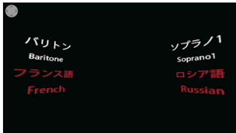
VR音響コンテンツサムネイル https://youtu.be/uZFWbI9Jfg