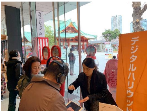
神田明神 東京都千代田区外神田2-16-2 iPadとヘッドフォンにて視聴