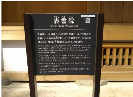
特別史跡名古屋城（本丸御殿）